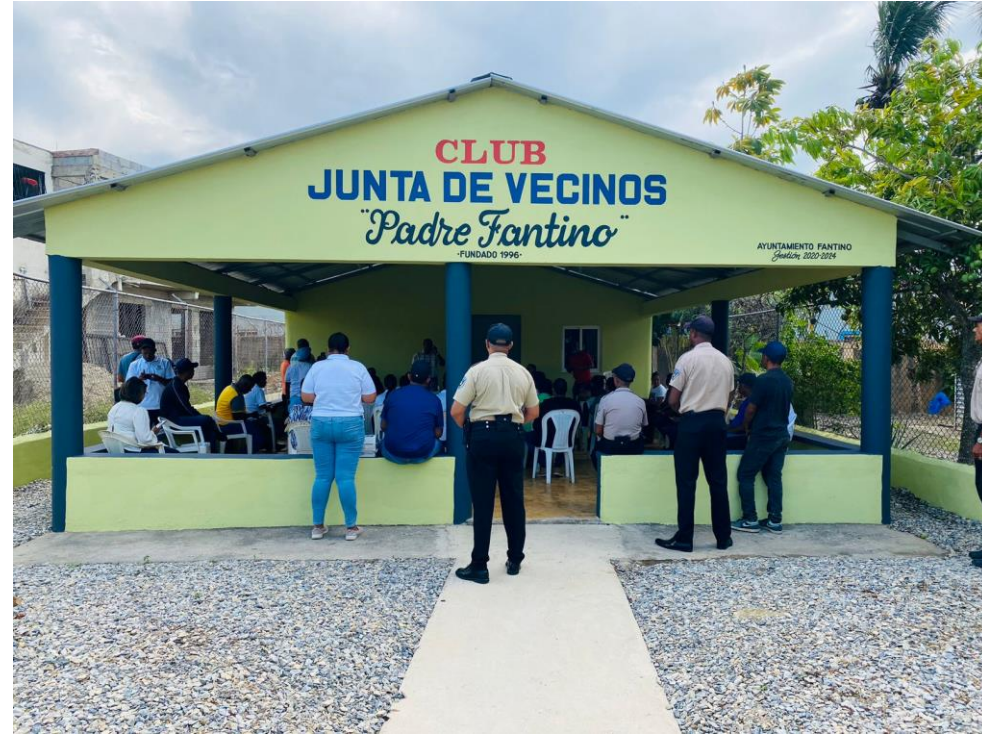
Club Padre Fantino Sector María Trinidad Sánchez