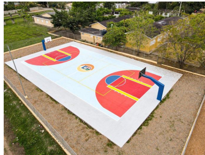
Cancha de baloncesto del sector El Baquetazo