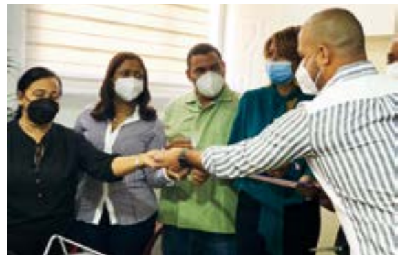
Diferentes momentos del acto de inauguración de los trabajos de renovación de las instalaciones del Ayuntamiento de Fantino.