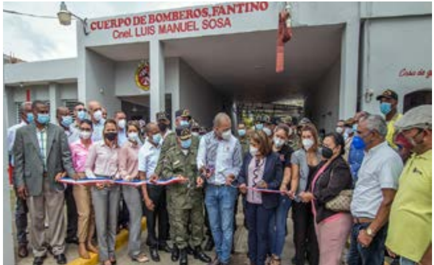
El cabildo municipal dispuso el remozamiento y ampliación del local del Cuerpo de Bomberos, con una inversión que supera los 800 mil pesos, según informó el alcalde municipal Gaby Padilla.

La obra estuvo a cargo del ingeniero Sander Vásquez, quien diseñó el proyecto que dignifica la labor de los miembros de los bomberos que realizan su servicio a favor de la población fantinense.