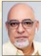
Miguel Ángel Alonso Contralor