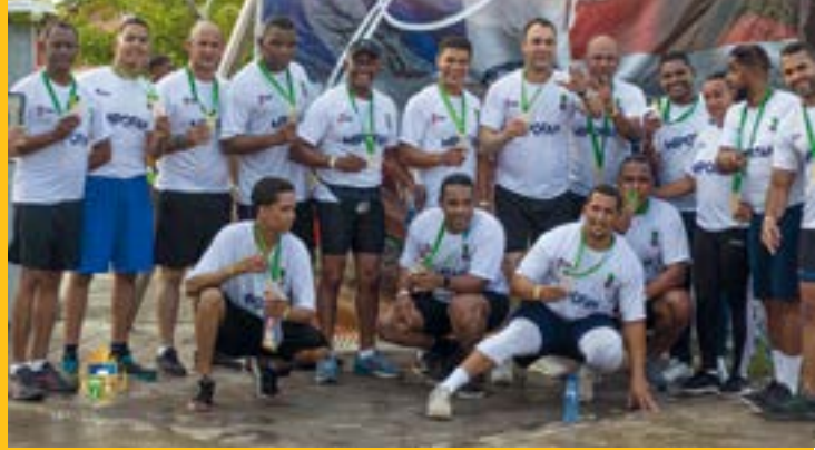
En el Ayuntamiento de Fantino apoyamos el deporte porque es un gran aliado de la salud, y una ciudadanía saludable es más activa y productiva. Promover el deporte y el bienestar colectivo. ¡Practica el deporte de tu preferencia, hazlo por tu salud física y mental!