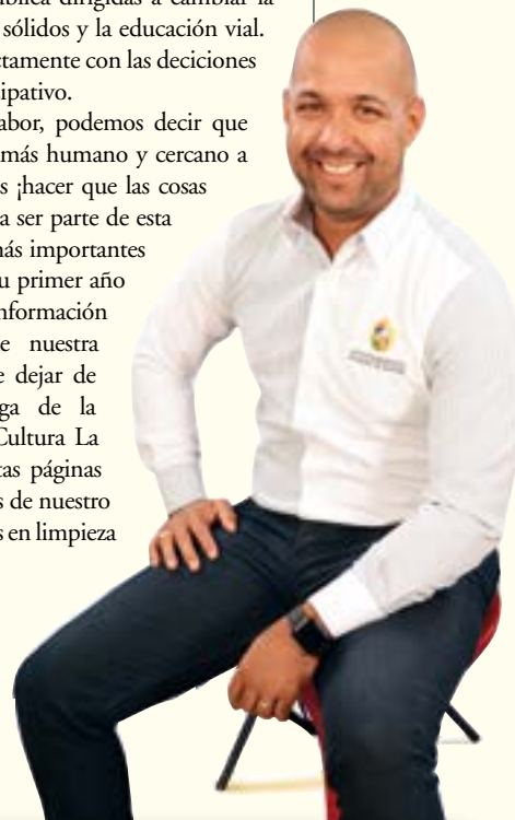
Ing. Gaby Padilla Alcalde Municipal de Fantino

Luego de un año de ardua labor, podemos decir que hemos logrado un gobierno local más humano y cercano a la gente, para que juntos podamos hacer que las cosas buenas sucedan! Por ello te invito a ser parte de esta revista, que documenta los hitos más importantes desarrollados por esta alcaldía en su primer año de gobierno local, que contiene información importante de la actualidad de nuestra ciudad entre la que no puedo de dejar de mencionar la importante entrega de la Biblioteca Municipal y Casa de Cultura La Piña. Además, informamos en estas páginas de importantes proyectos y avances de nuestro Plan de Inversiones, junto a mejoras en limpieza y distintos servicios municipales.