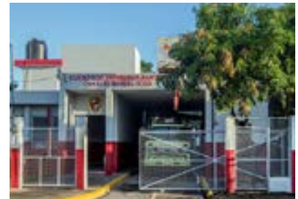
Los trabajos de ampliación y remozamiento incluyeron desde la construcción de habitaciones, baños, así como colchones nuevos y corrección de filtraciones.