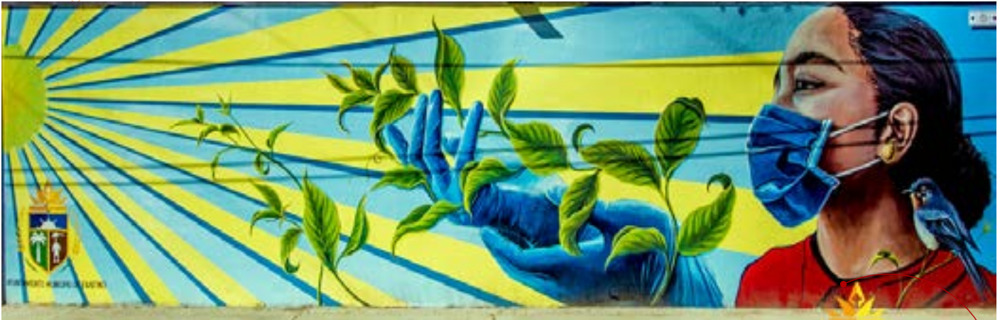
Mural 1 Prevención Memorial al Covid-19 , inaugurado el 12 de mayo 2020 en el marco de la celebración del Día Mundial de las Enfermeras.