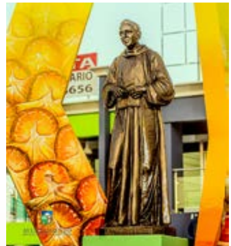
Como homenaje al Padre Fantino, su estatua engalana el monumento homónimo.